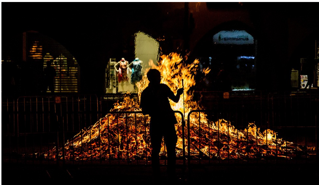
Revetlla de Sant Joan a la plaça Major de Vic | Adrià Costa

A partir del dia 25 es preveu que arribi la primera onada de calor de l'estiu