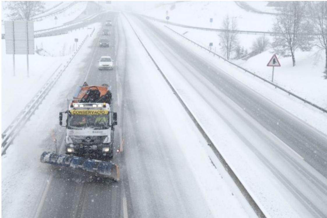
La C-17, a Santa Cecília de Voltregà.