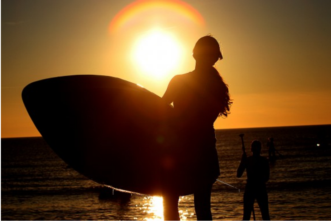
L'estiu ja és oficialment aquí.

una Catalunya convertida en un forn i s'hauran d'extremar les precaucions per evitar incendis forestals.