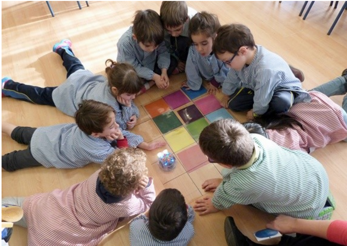
Escola Puigcerver.

L'Escola Puigcerver és una escola integradora , no desestimen cap alumne amb dificultats d'aprenentatge, sinó que opten per fer-lo créixer segons les seves possibilitats perquè adquireixi el màxim grau d'autonomia. Fins i tot contempen el fet de tenir alumnes amb un nivell intel·lectual elevat, per això també tenen una metodologia adaptada per aquests casos.