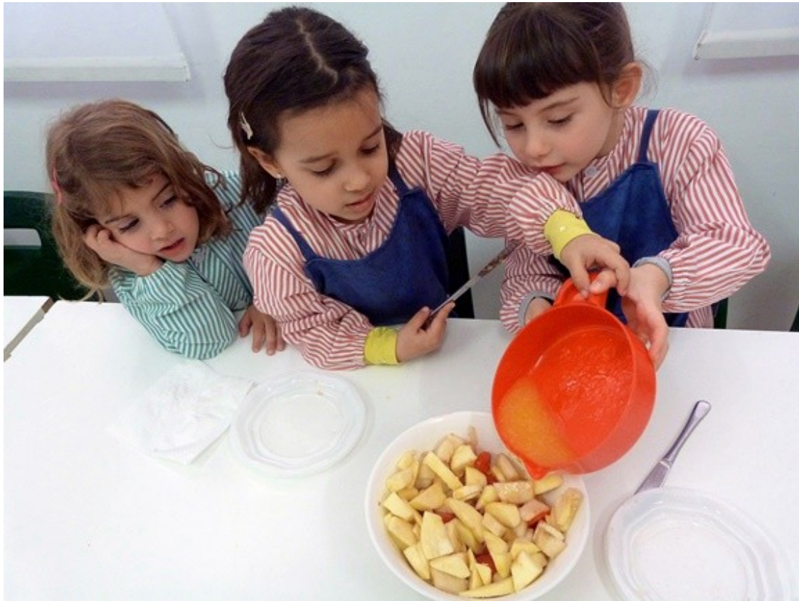
Escola Puigcerver.

És una escola verda , el programa «Escoles verdes» sorgeix com un compromís per donar suport a tots els centres educatius de Catalunya que volen innovar, incloure, avançar, sistematitzar i organitzar accions educatives que tinguin la finalitat d'afrontar, des de l'educació, els nous reptes i valors de la sostenibilitat. Enguany l'Escola Puigcerver engegarà un projecte d'agermanament amb l'Escola Thierno Mamadou Sall del Fatick, al Senegal. Duran a terme diverses activitats que tenen un objectiu comú: la protecció del medi ambient i la gestió dels residus.