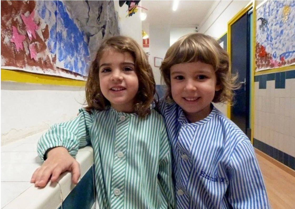
Escola Puigcerver.

Les dades referents als alumnes de l'Escola Puigcerver que superen les etapes educatives i les proves de selectivitat (PAU) són molt positives. Curs 2014-2015: 93% a educació primària, 96% ESO, 88% BAT, 100% selectivitat.