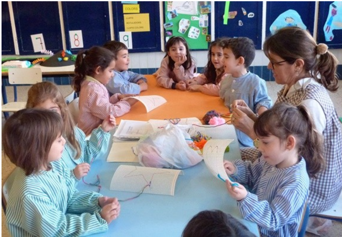
Escola Puigcerver.

El proper 27 de febrer a les 11.00 hores l'Escola Puigcerver, situada al carrer Astorga número 13 de Reus, farà la jornada de portes obertes per a tots aquells pares que hagin d'inscriure els seus fills a un centre educatiu per al pròxim curs, d'aquesta manera podran conèixer de primera mà l'escola i comprovar l'èxit de la seva metodologia pedagògica, l'oferta integral que ofereix el centre als alumnes des de P3 fins al segon curs de batxillerat, i veure les seves àmplies instal·lacions amb espais plens de llum i patis amplis.