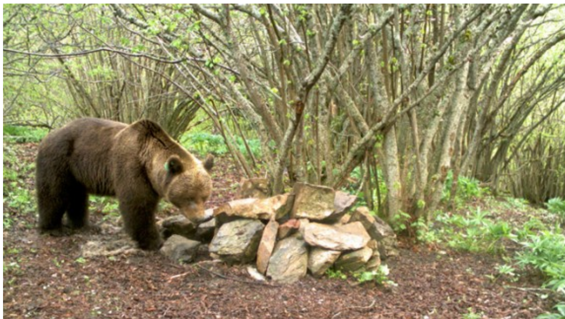
Imatge de l'os Goiat.

Un dels principals punts del nou protocol és la inclusió, entre les tipologies d'ossos problemàtics, de la figura ?d'os altament depredador?, que causa conflictes anòmals amb la ramaderia. L'altra és el tractament diferenciat que es vol donar als ossos reintroduïts (on hi ha un plus de responsabilitat i gestió) respecte dels nascuts als Pirineus.