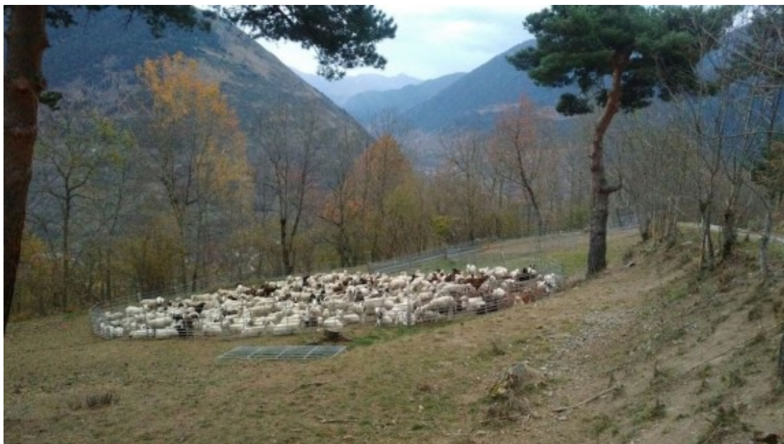
Un agrupament de ramats al Pirineu.

A banda de les indemnitzacions i ajuts, Catalunya, a diferència d'altres territoris, ha posat en marxa un dispositiu de prevenció dels danys, amb un equip tècnic a la Val d'Aran i el Pallars Sobirà. Entre les mesures preventives impulsades en el marc del projecte Piroslife de reintroducció de l'os al Pirineu, l'agrupament de ramats d'oví és dels que presenta uns millors resultats. El 2017, els ramats no protegits o protegits de forma incorrecta han tingut 20 vegades més depredacions que els ramats ben protegits pel projecte Piroslife.