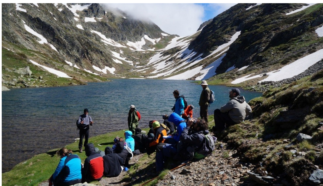
Sortida de camp d'un curs de guies del Parc Natural de l'Alt Pirineu

Els municipis reclamen que l'ampliació vingui acompanyada de més recursos de personal i finançament