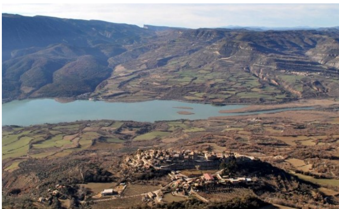
La falta de pluges no sembla afectar els embassaments pallaresos.

Al sud del Pallars Jussà fa més de 60 dies que no hi plou | Els embassaments pallaresos, no obstant, es troben al voltant del 70%