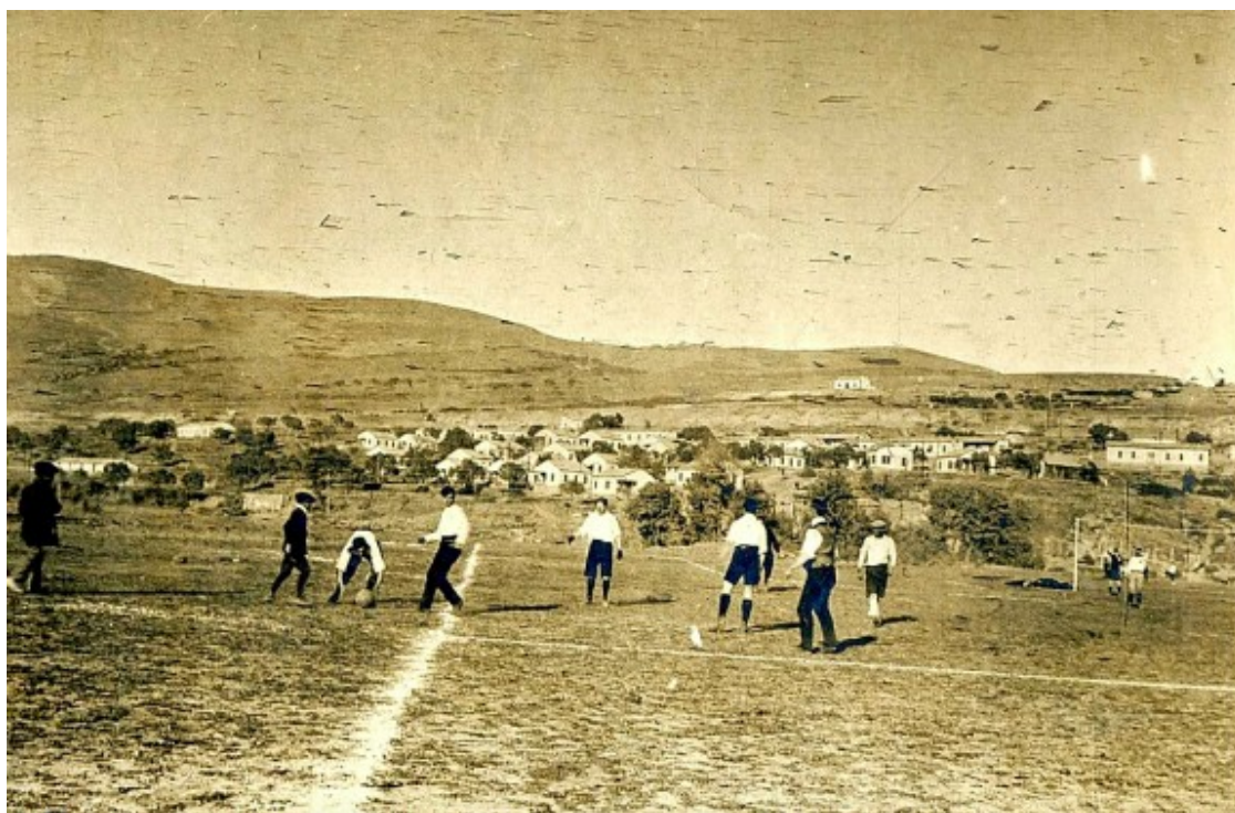
Treballadors de Riegos y Fuerzas del Ebro jugant un partit de futbol al campament.