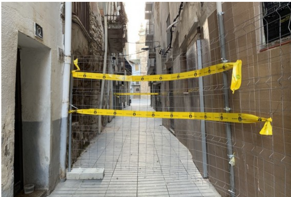
El carrer del Forn de Tremp, tallat per seguretat.