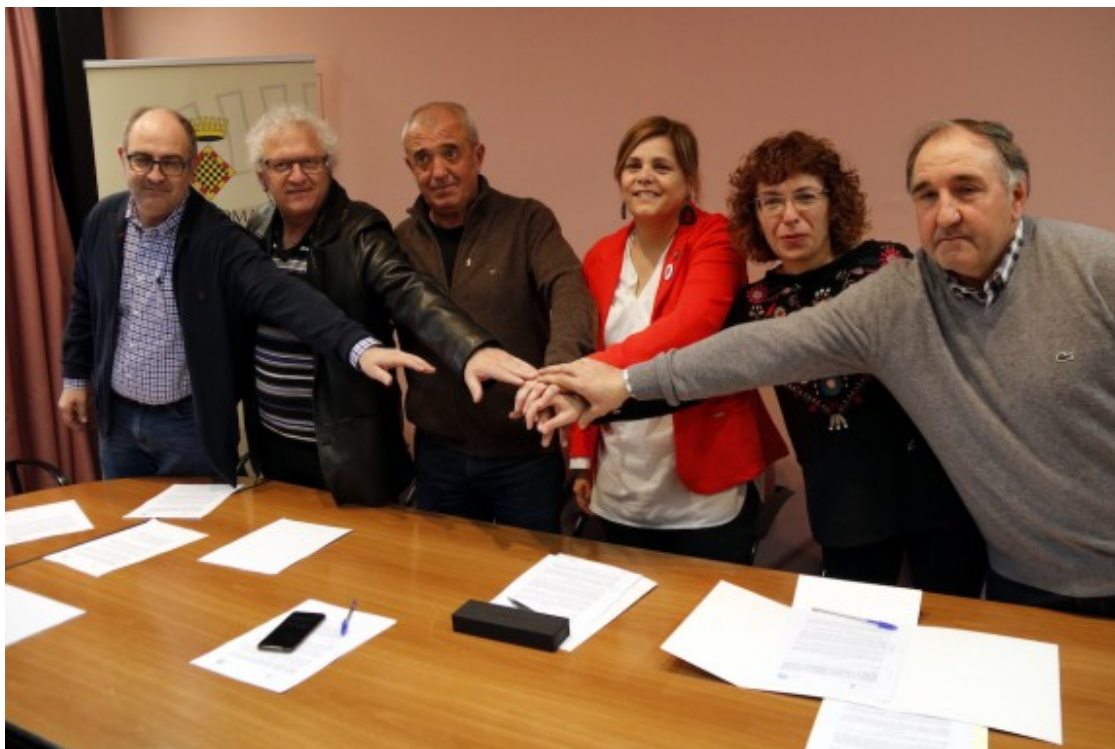
Alcaldes de l'entorn de Mont-rebei i els presidents dels consells un cop signat l'acord.

Ha posat com a exemple el fet que mentre el pont penjat ha estat tancat des del novembre per millorar la seguretat, s'han detectat persones que hi han passat igualment, tot i les indicacions de prohibit el pas. A més a més, també s'ha vist gent que es llança de dalt cap a baix d'aquest pont. Cañadell ha demanat a la gent que sigui conscient del risc que suposa tot això perquè "nosaltres no ens en podem fer càrrec".