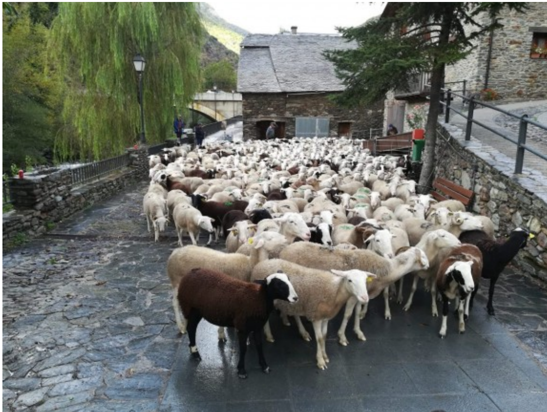
Un ramat agrupat aquesta temporada.

efectiva per minimitzar baixes en els ramats d'oví durant els mesos d'estiu, quan pasturen en la zona de presència permanent d'ossos a cotes altes.