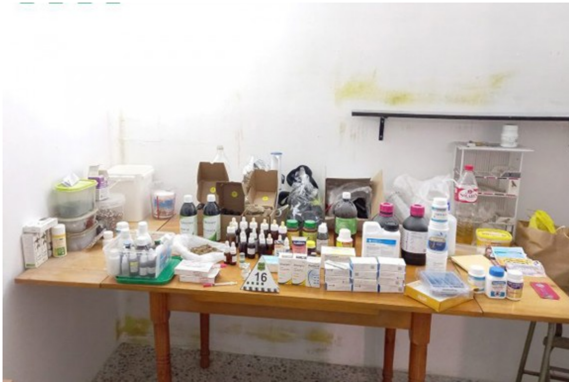
El material per fer cantar els ocells que pot resultar molt perjudicial.