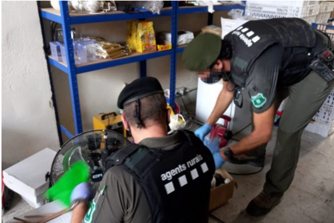
Agents Rurals durant l'escorcoll.

D'altra banda, a l'habitatge s'hi van trobar 20 ocells més, però aquests estaven individualitzats i amb indicis que se'ls subministraven productes estimulants per participar en concursos de cant. Es van comissar més de 100 envasos d'aquests productes que s'han portat a analitzar. Segons els Rurals, aquest tipus de productes podrien ser perjudicials per a la salut dels ocells i fins i tot podrien haver provocat la mort prematura de com a mínim dos exemplars. Al domicili de l'investigat també s'hi van intervenir 2.497 euros, presumptament provinents de la venda il·legal d'ocells fringíl·lids .