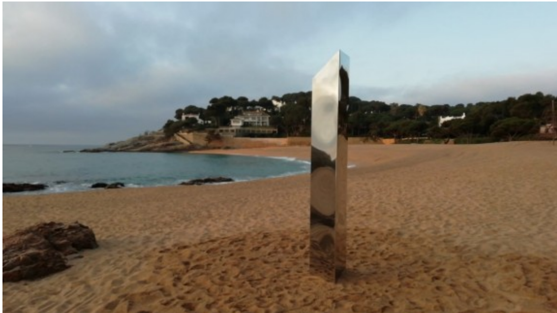
El monolit a la platja de S'Agaró.

V?deo: https://www.youtube.com/watch?v=cHWs3c3YNs4