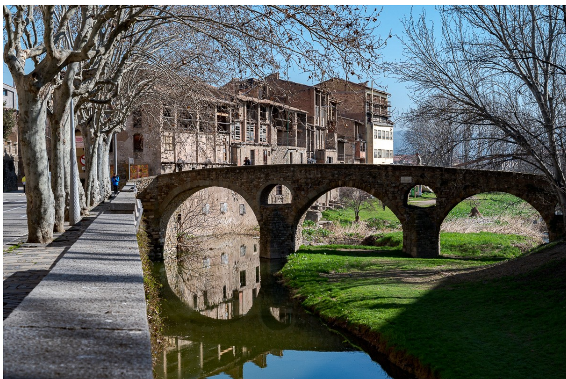
Les Adoberies de Vic | Josep M. Montaner

Els projectes del servei de dinamització cultural del Terrat d'en Cols i l'habilitació d'una sala de penal a Vic també fan un pas endavant en l'últim ple del 2020