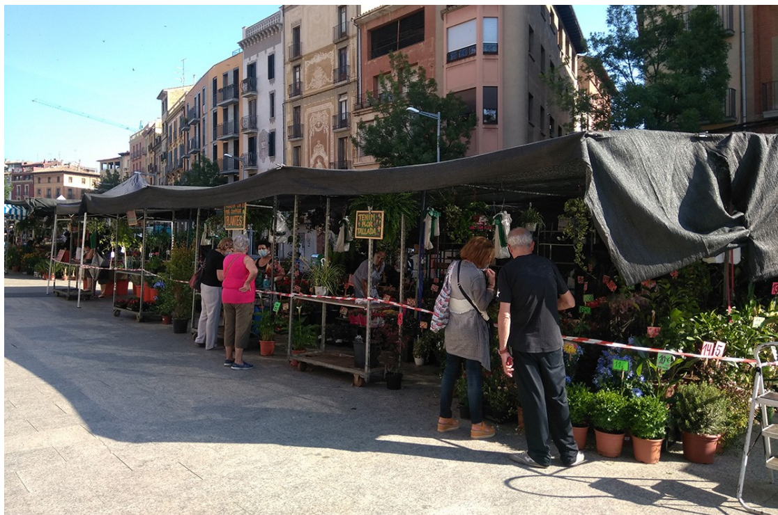
Un dia de mercat al passeig

La iniciativa accelera la creació del pulmó verd al centre de la ciutat