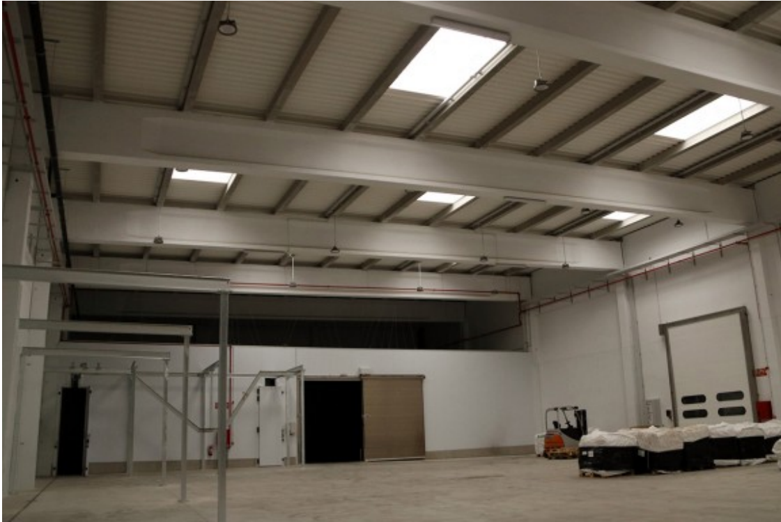
Una de les naus que servirà per a la distribució de les pells de Colomer 1972