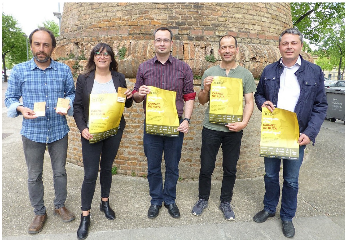
Presentació del carnet del Camí Oliba | Consell Comarcal del Ripollès

El distintiu permetrà disposar de beneficis i descomptes en equipaments públics, allotjaments, restaurants i altres serveis