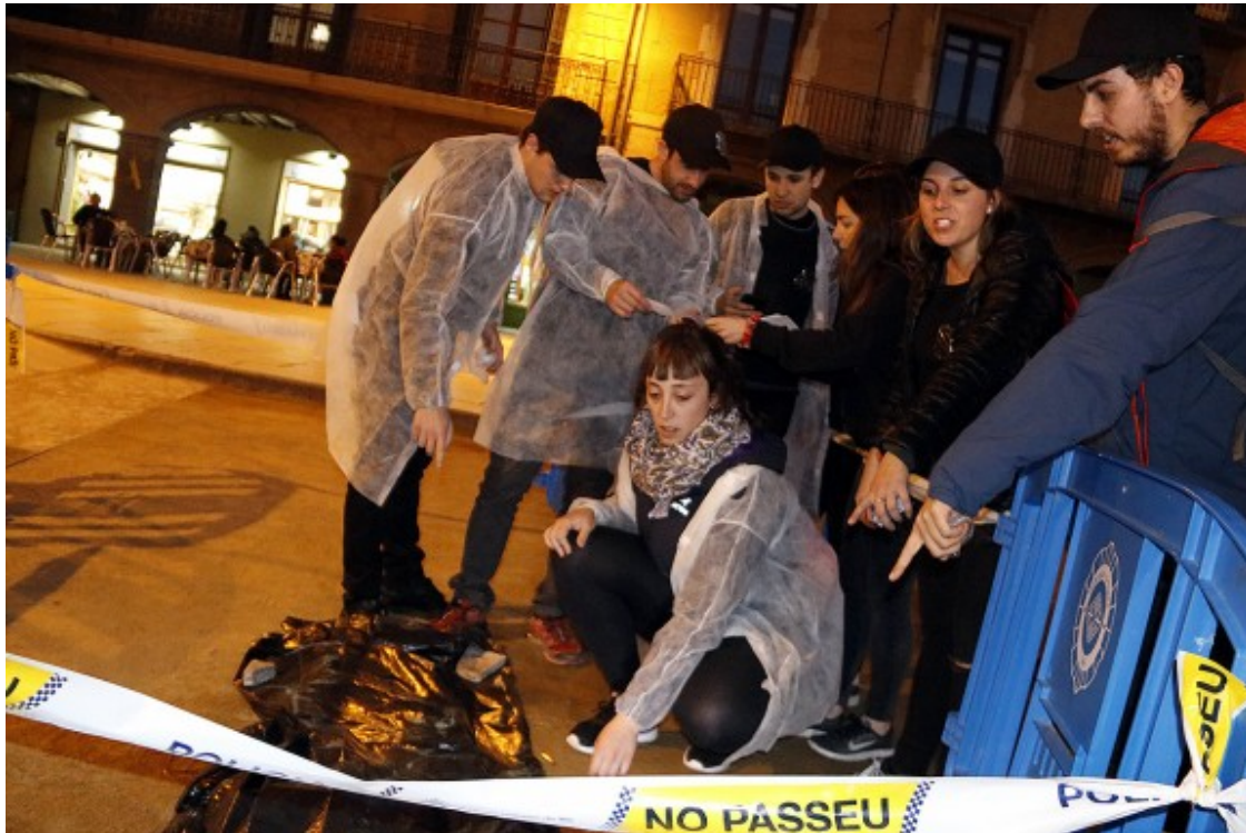
L'escena del crim que s'ha instal·lat a la plaça Major de Vic durant el «City Escape Room»

La resolució de l'enigma "Codi 060" durava dos dies i els participants havien de fer nit en un dels hotels de Vic per descobrir qui havia assassinat el titular de Sanitat de la República. A través del joc, i amb l'objectiu també de ser un reclam turístic per la ciutat, els participants -de la Garrotxa, Tarragona, Girona, Lleida, Maresme, Barcelona i Vic- van conèixer els punts més emblemàtics de la ciutat.