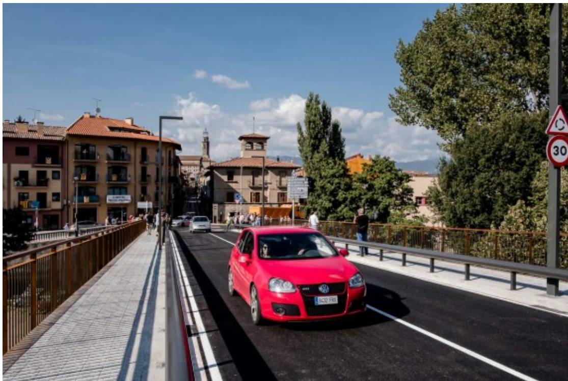
El primer cotxe que ha creuat el pont de Can Molas.