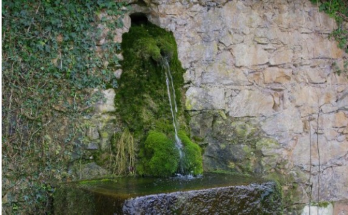
Font de Vilarjoan.