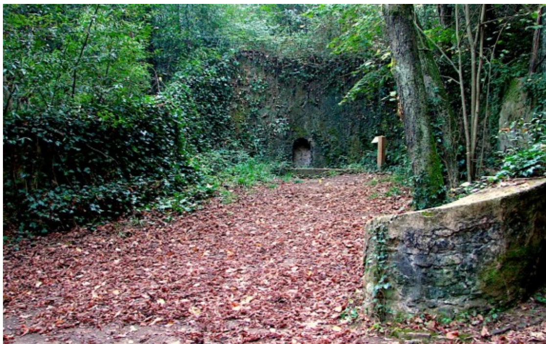
La font de Can Catà, a Cerdanyola.

A l'aplicatiu hi podreu trobar fonts com aquestes: