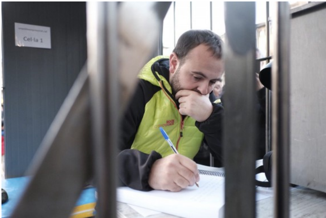
En Peyu escrivint al quadern que hi ha a la cel·la