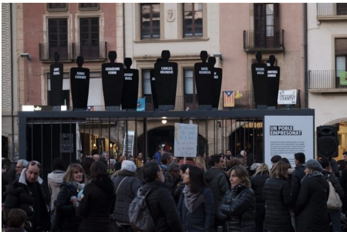
Deu figures per cadascun dels presos