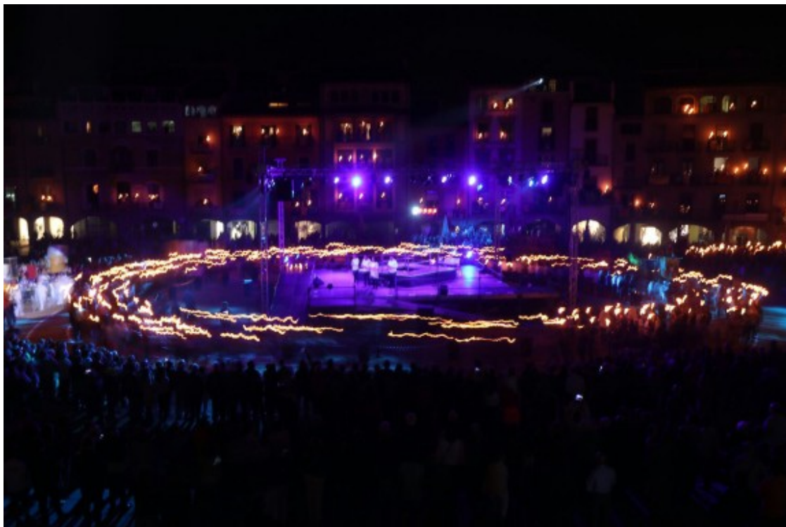
La Marxa dels Vigatans ha concetrat milers de persones a la plaça de Vic.

que envoltava l'escenari. Els balcons també hi han jugat un paper important, ja que aquesta edició, no només s'han il·luminat el primer pis com els darrers anys, sinó que segons i tercers també tenien la seva torxa.