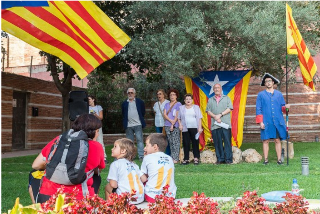
Acte d'homenatge a Bac de Roda, a Roda de Ter