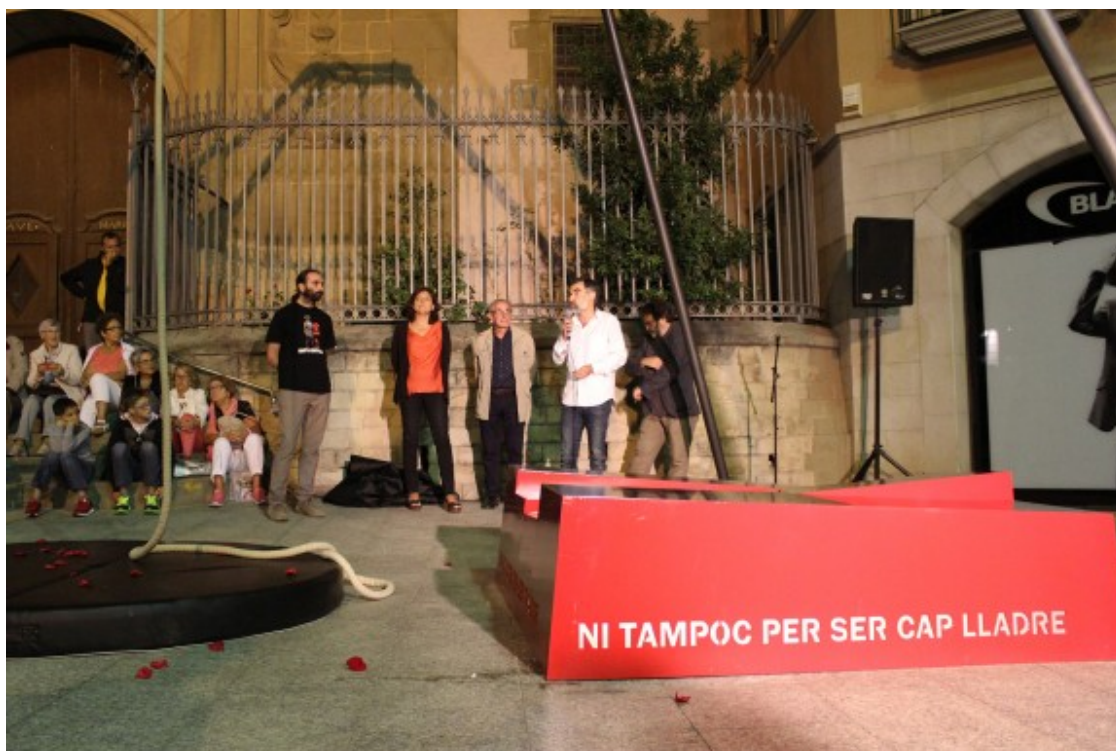
Durant la inauguració del monument.