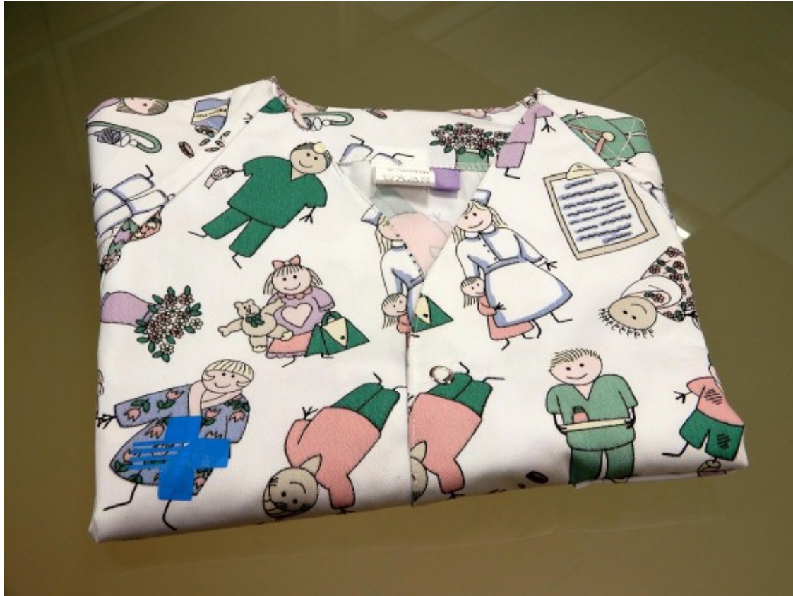
La nova bata té motius divertits i infantils.