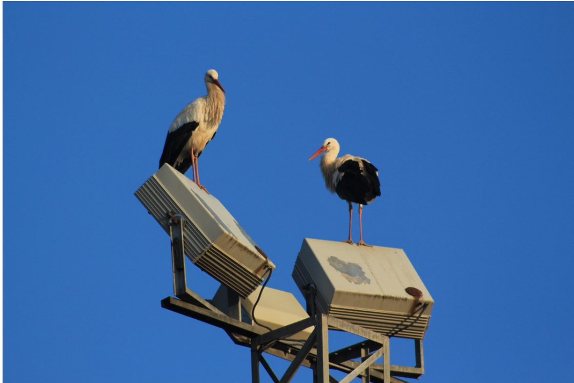
Dues de les cigonyes fen una parada a Roda de Ter

El fotògraf Domènec Llop capta les aus fent parada al municipi