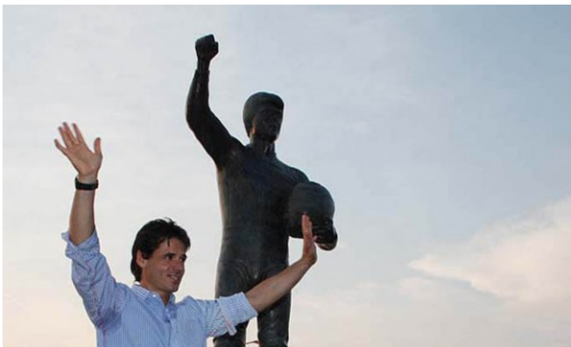
Àlex Crivillé davant l'escultura instal·lada a l'entrada de Seva

Apareixen noves informacions relacionades amb la filtració massiva de presumptes evasors fiscals | El pilot de Seva cobrava els seus drets d'imatge a través d'una empresa "offshore"