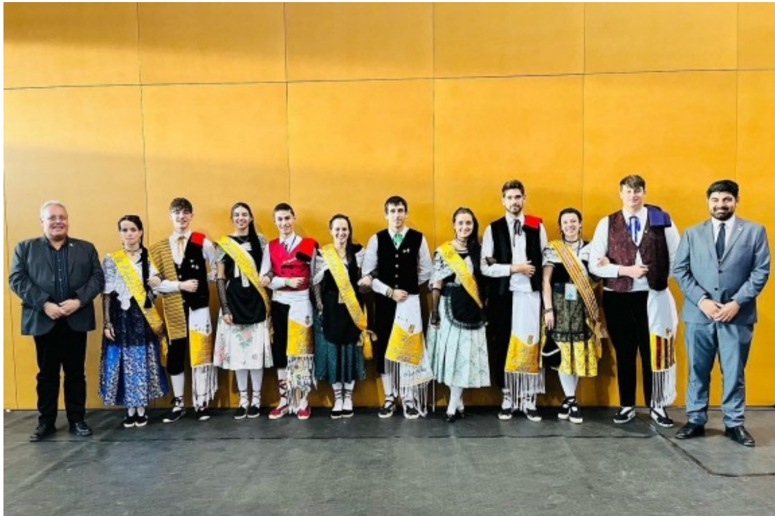
Foto de família dels nous representants nacionals del Pubillatge