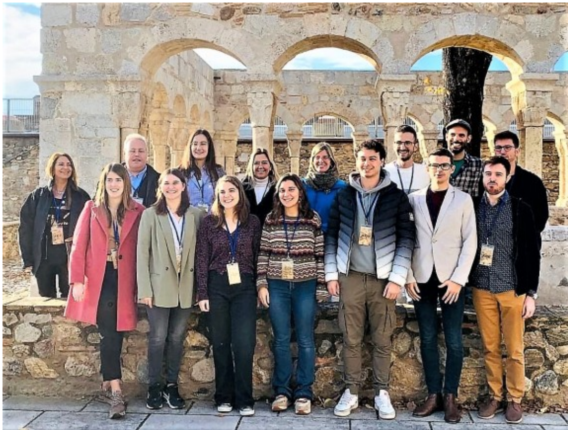
L'equip d'examinadors

Després d'haver estat realitzant una doble prova, escrita i oral, a la cinquantena de candidats i candidates (21 nois i 28 noies) al llarg de tot el dissabte, el jurat ha acordat proclamar els següents títols: