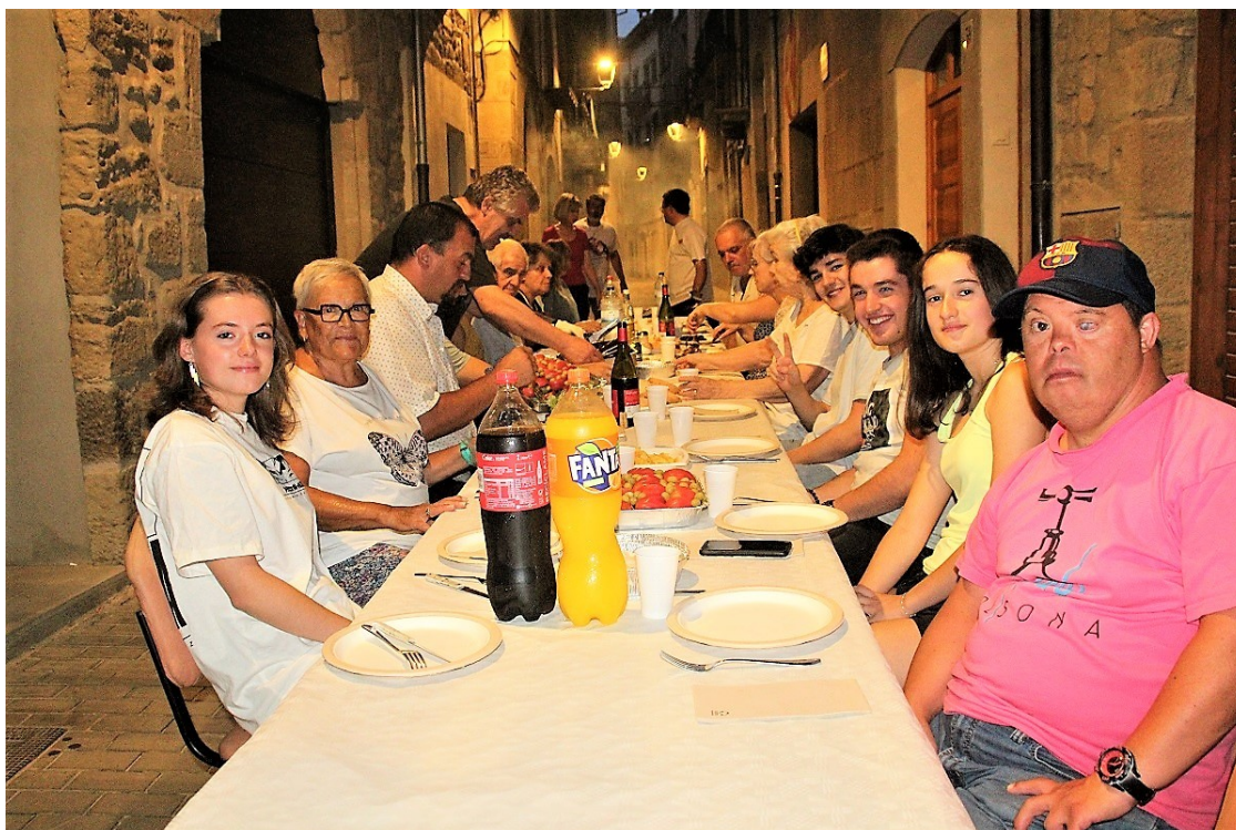
La taula del Carrer de Sant Llorenç | Ramon Estany

Sant Pau, Sant Llorenç i Sant Salvador van aplegar el seu veïnat al voltant de les taules al mig del carrer