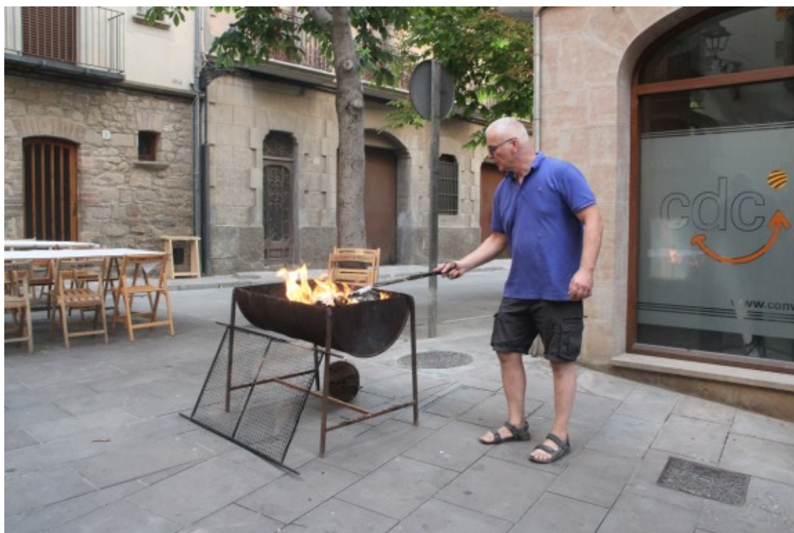
Un dels xefs del Carrer Sant Pau