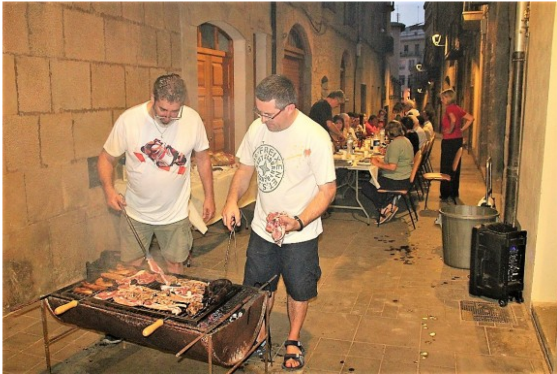
Els cuiners preparant la carn al carrer de Sant Llorenç

Dissabte passat, NacióSolsona va donar un tomb per tres dels sopars que s'hi celebraven a peu de carrer per Solsona. Només calia guiar-se per la flaire de la carn i les botifarres a la brasa, el plat típic d'aquests sopars, que s'acompanya sovint amb un bon pa amb tomàquet, unes amanides i truita amb patates.