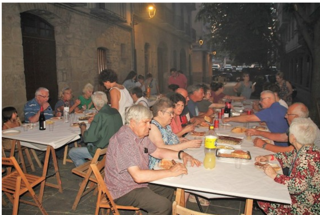
Entaulats al carrer de Sant Pau

A falta de música en viu i en directe, el veïnat s'acompanyava la vetllada amb un equip de música, mentre feien la conversa i gaudien de la fresca nocturna.