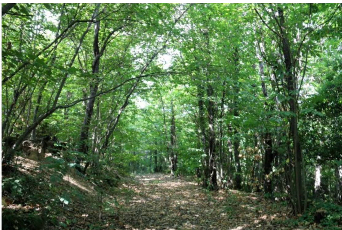
Un bosc de castanyers