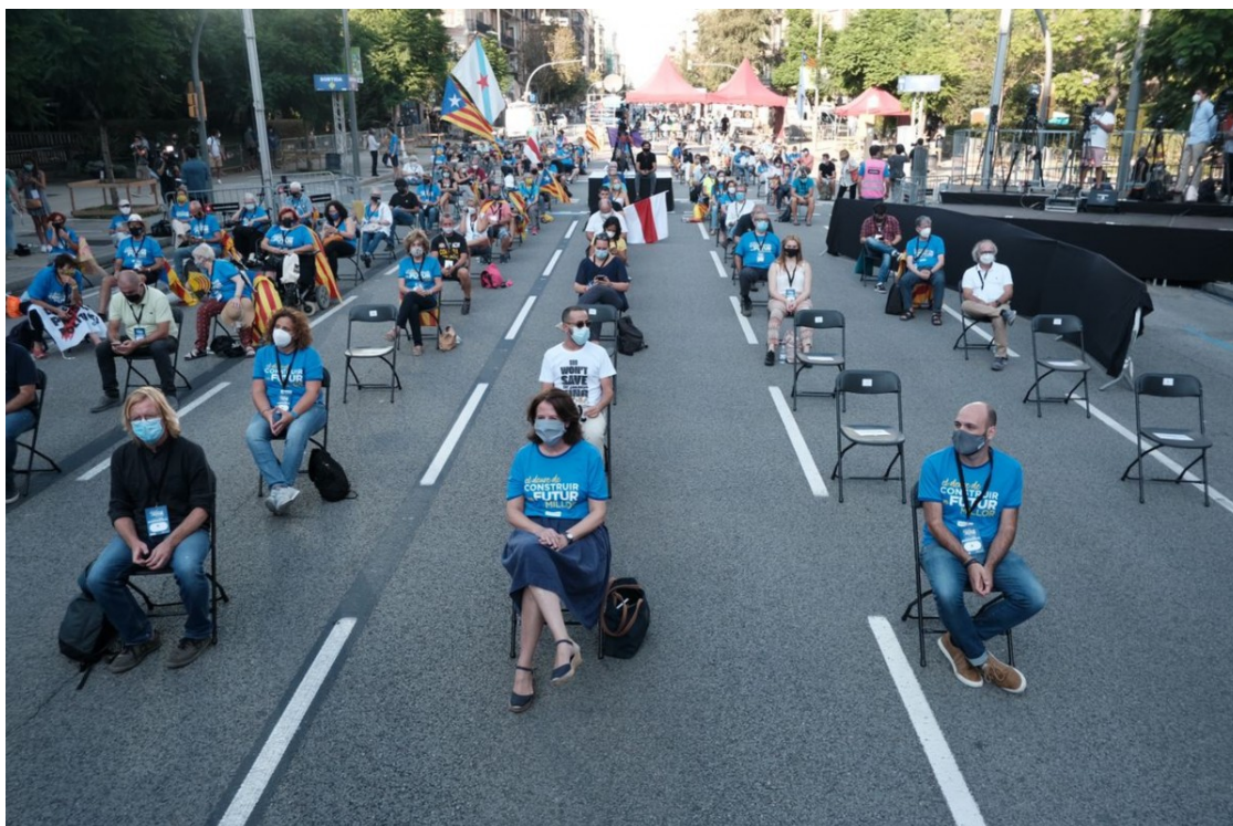
Acte de la Diada a Barcelona.

La manifestació de l'11 de setembre serà el tret de sortida d'un cicle de mobilitzacions que s'allargaran fins els dies 1, 2 i 3 d'octubre