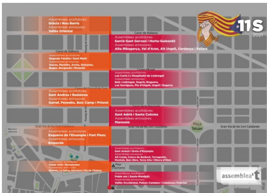
Les zones de concentració per a l'inici de la manifestació de la Diada