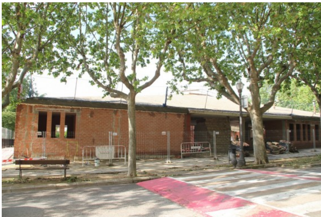
El futur tanatori de Solsona queda inclòs dins l'entorn de protecció