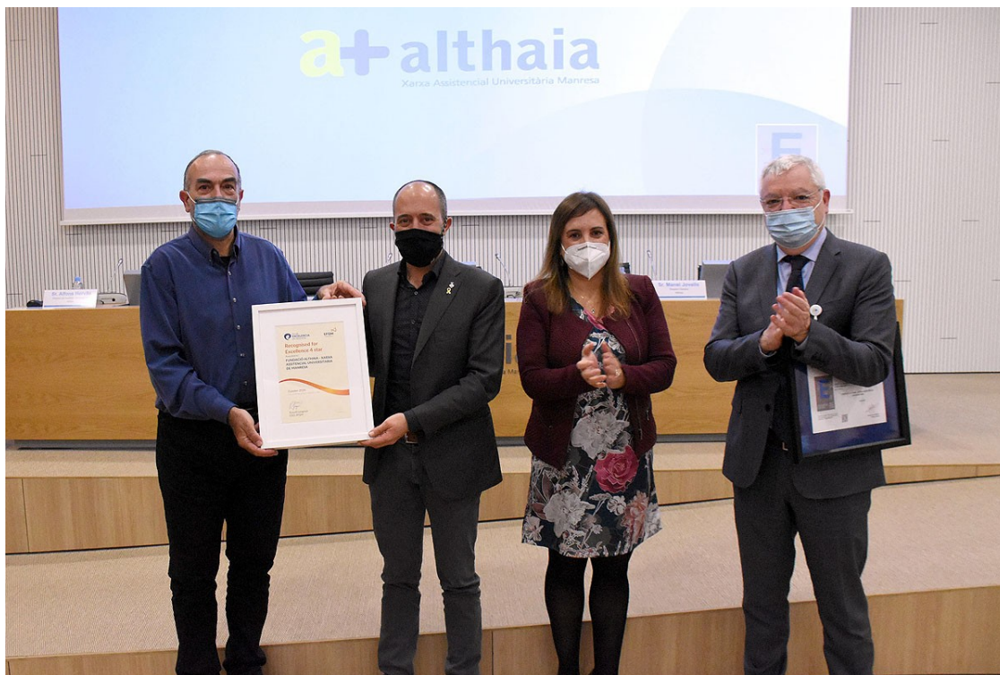
Autoritats d'Althaia recollint el reconeixement

La institució ha estat reconeguda amb la distinció que concedeix el Club Excel·lència en Gestió i que a Espanya només tenen 70 centres sanitaris