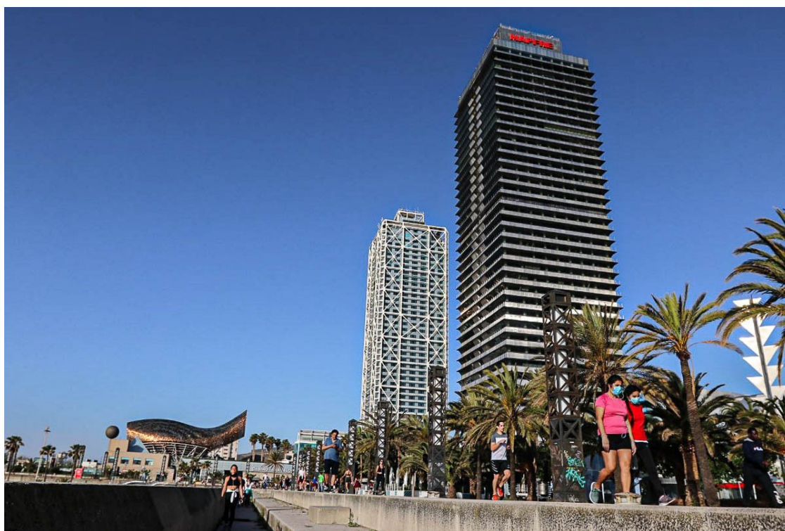
El passeig a l'alçada de les Torres de Mapfre, a Barcelona | Adrià Costa

L'Ajuntament de Barcelona considera que la capital complia els requisits epidemiològics per prosperar en la desescalada però Salut no l'ha demanat finalment