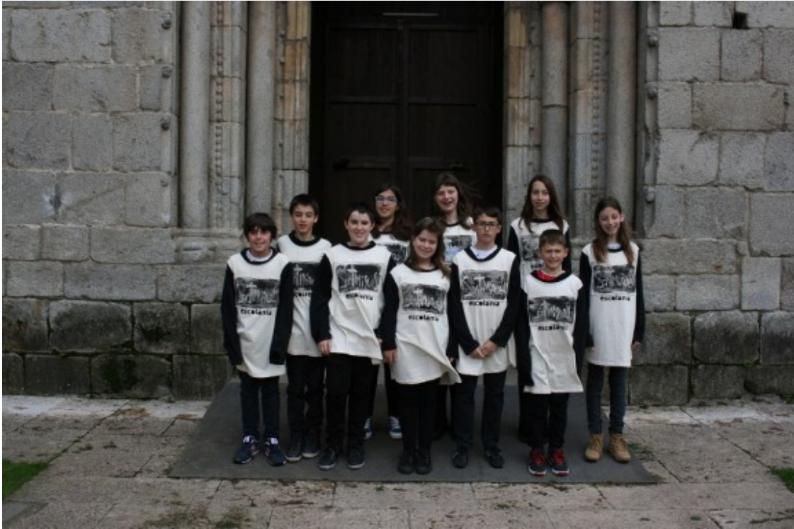
Escolania St. Miquel a la Catedral de la Seu d'Urgell (2016)