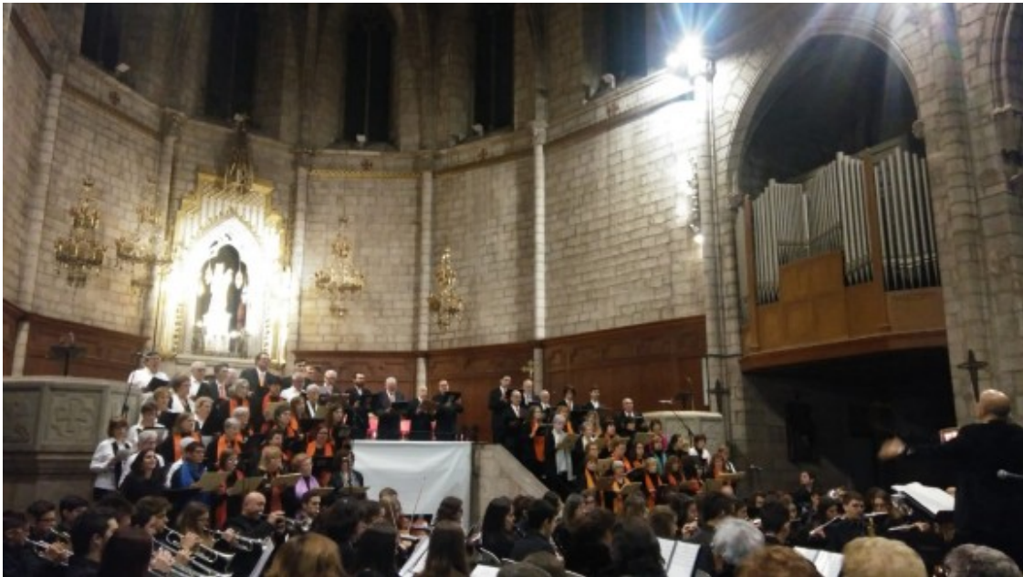
Pasada edició del Tradicional Concert de la Coral Cardonina amb l'orgue presidint la capella lateral del prebisteri