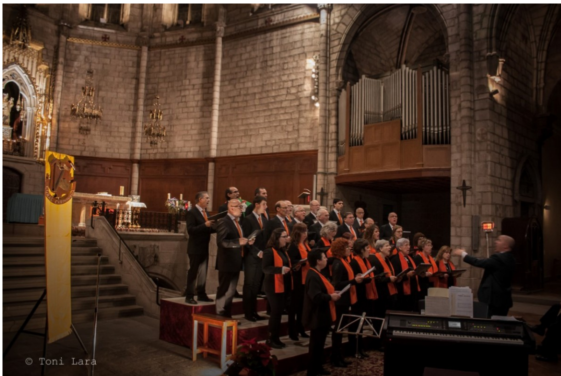
Actuació de la Coral Cardonina amn l'orgue de Sant Miquel al fons (2015)

La parròquia de Cardona, amb la col·laboració de diverses entitats de la vila, ha impulsat una campanya per a la restauració de l'orgue de l'església parroquial que comprendrà diferents actes i iniciatives al llarg d'aquest any