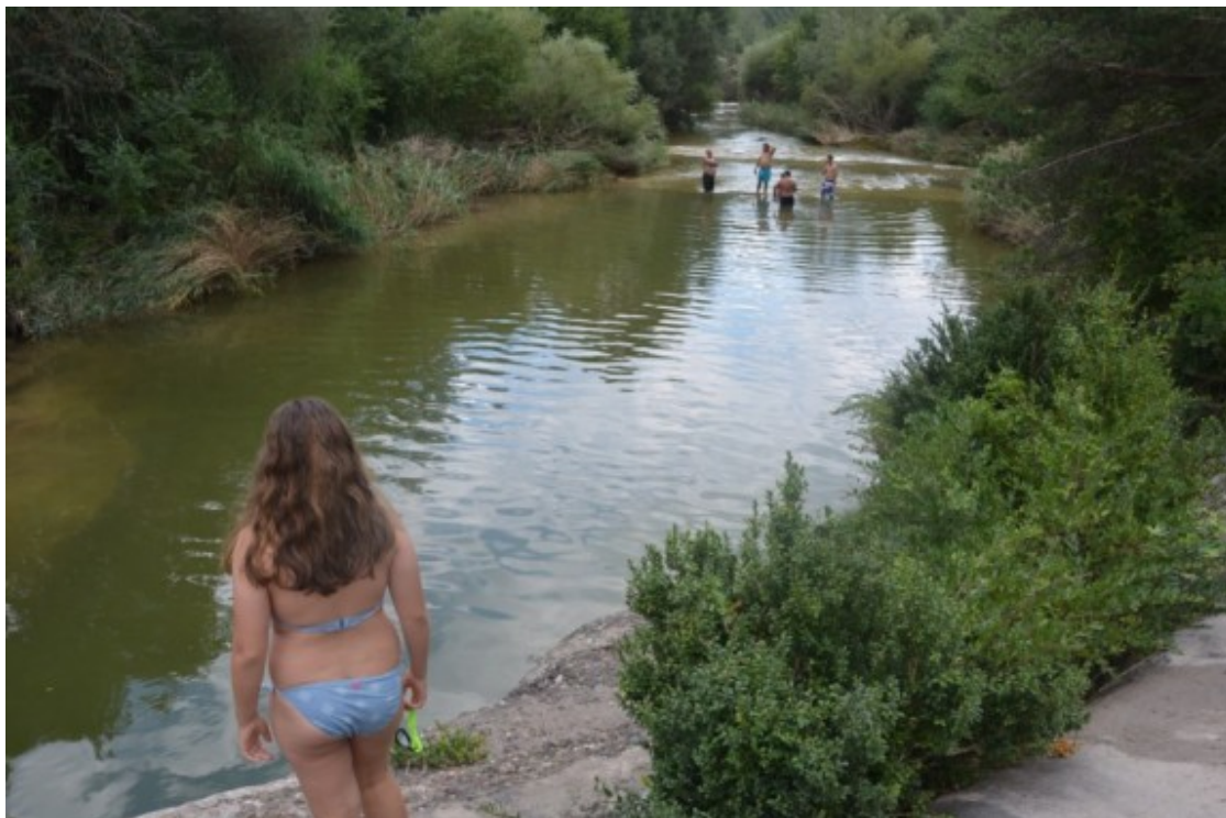
Banyistes a la riera de Merlès.

Llamas també ha anunciat que atesa l'elevada presència de visitants a la riera de Merlès, en el moment en el qual els ajuntaments ho demanin, es doblarà el servei de guarderia rural . D'aquesta manera hi haurà dues patrulles controlant que es compleixi la normativa aplicable ( https://bergueda.eadministracio.cat/transparencia/d1ab225b-f78a-4fdb-b24e-646ceb288b70/ ) .