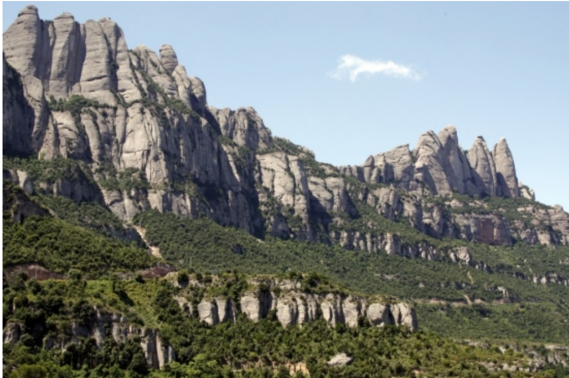
Vistes generals de la muntanya de Montserrat.

L'acció reivindicativa es durà a terme la nit del 10 a l'11 de setembre