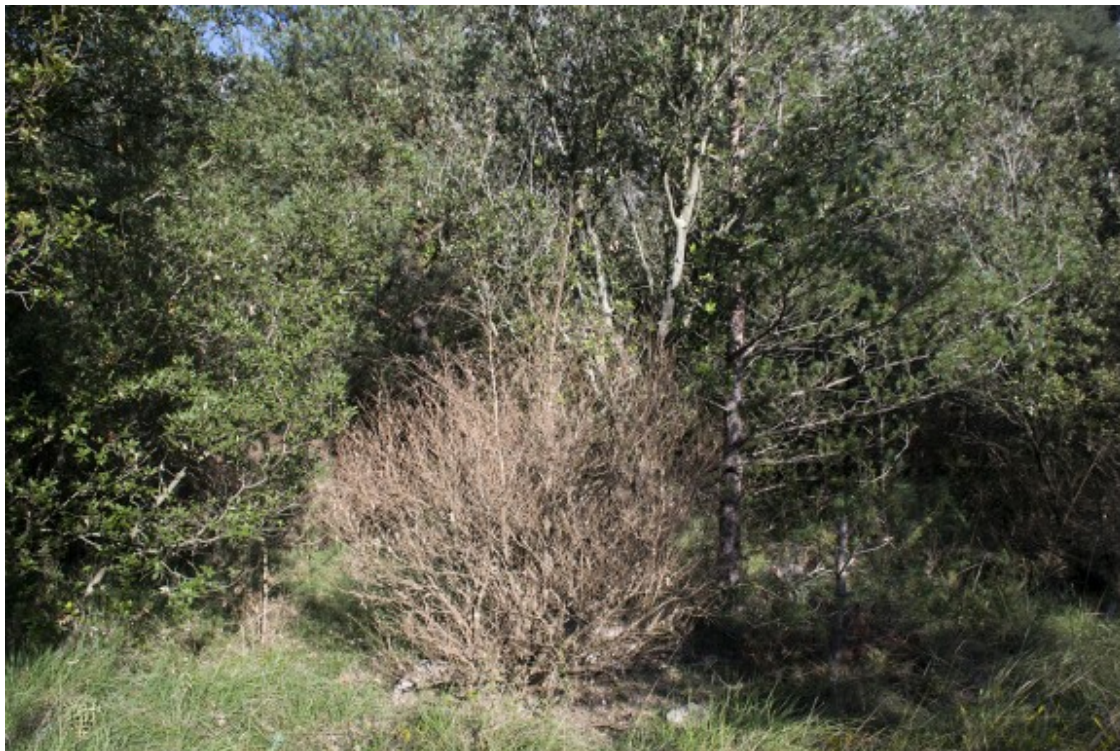
Un arbre afectat per l'eruga del boix