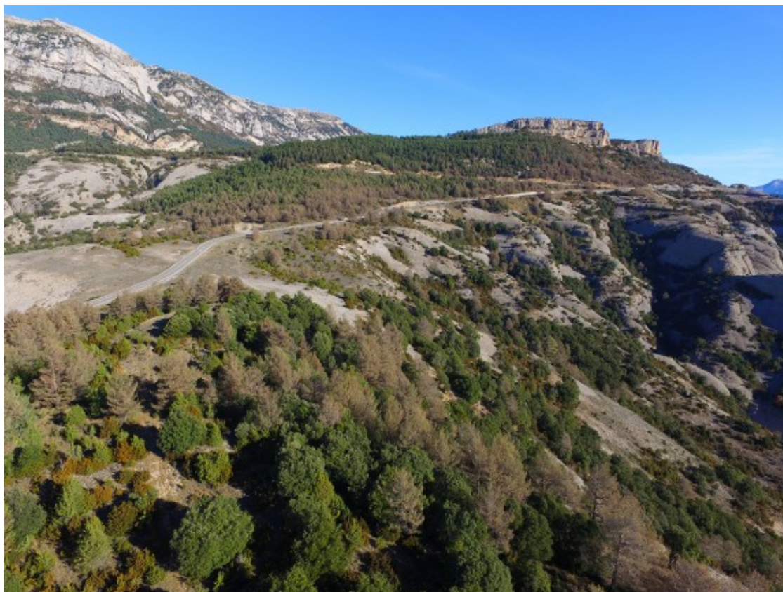
Bosc afectat per processionària.