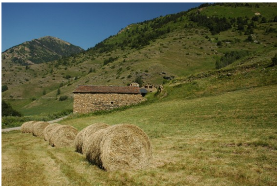
Prats de dall al Parc Natural de l'Alt Pirineu. | Gencat.

S'afegeixen prop de 9.500 hectàrees noves dels nuclis de Farrera, Rialp, Alt Àneu, Llavorsí, Soriguera i les Valls de Valira