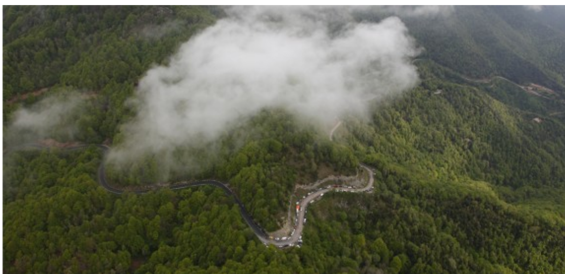
Imatge aèria d'una edició anterior de la cursa cicloturista que recórrer la Garrotxa, el Ripolès i Osona

Trobareu totes les informacions pertinents al web Terra de Remences ( http://www.terraderemences.com ) .