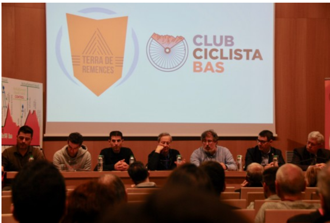
Can Trona ha acollit la presentació de la XXI Terra de Remences.