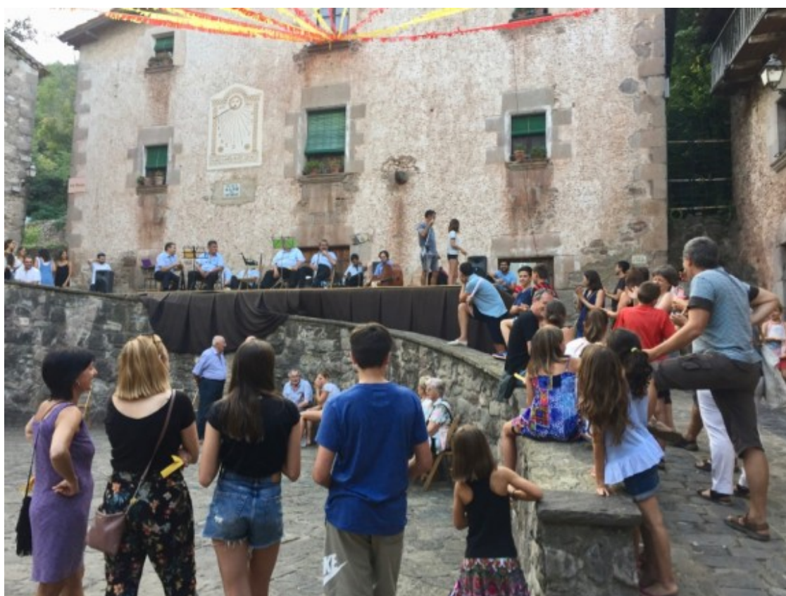
La plaça del nucli antic de Sant Privat d'en Bas acollirà aquest diumenge el 3r VertiKalm.

Aquesta cursa de 5,2 km i 1.000 m de desnivell puntua per a la 8a Copa Catalana de Curses Verticals de la FEEC