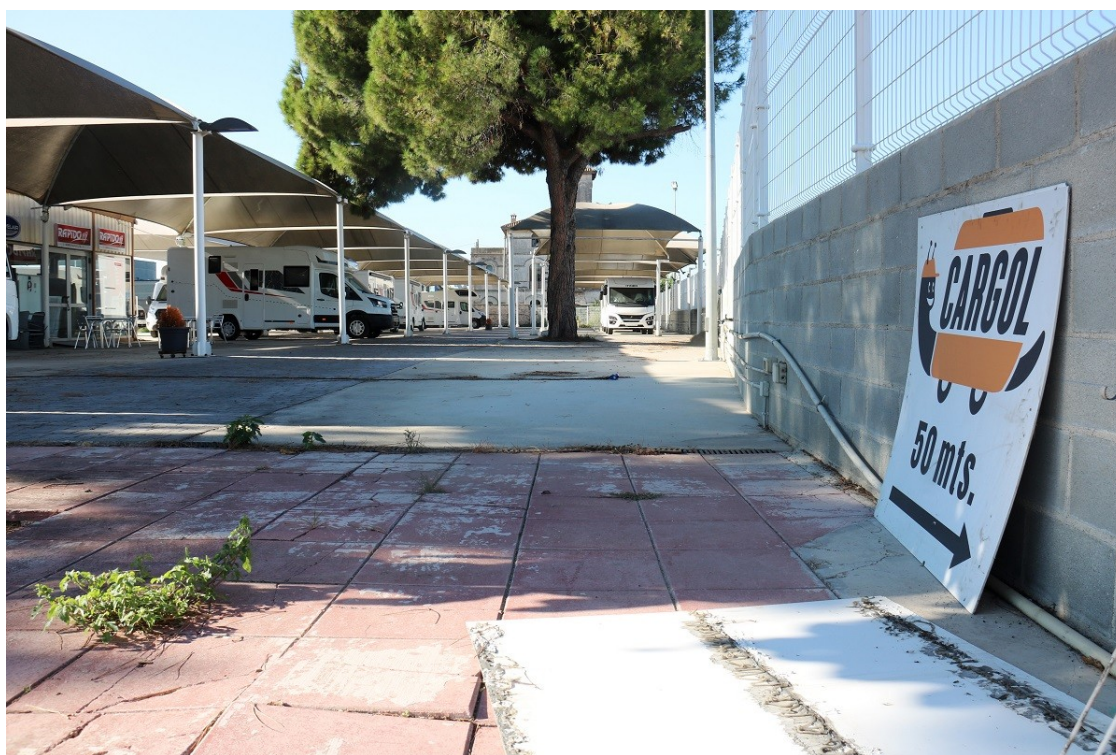
Un cartell de Caravanes Cargol a la zona d'exposició d'autocaravanes

Alguns clients, preocupats però la propietat assegura que retornarà els diners de les entregues pendents