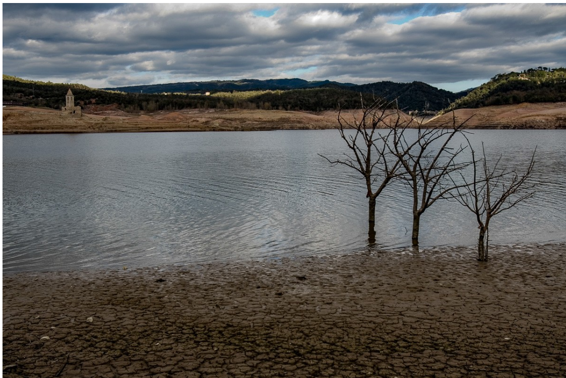
El pantà de Sau durant un episodi de sequera

L'ACA classifica Catalunya segons la situació dels pantans i els aqüífers: normalitat, prealerta ?quasi tot el país-, alerta, excepcionalitat i emergència