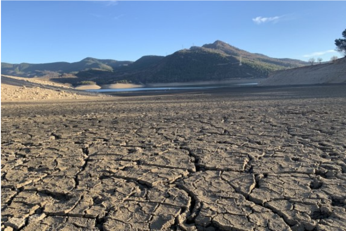
Imatge recent del pantà de Sant Antoni.

Més mesures comunes, específiques i de gestió