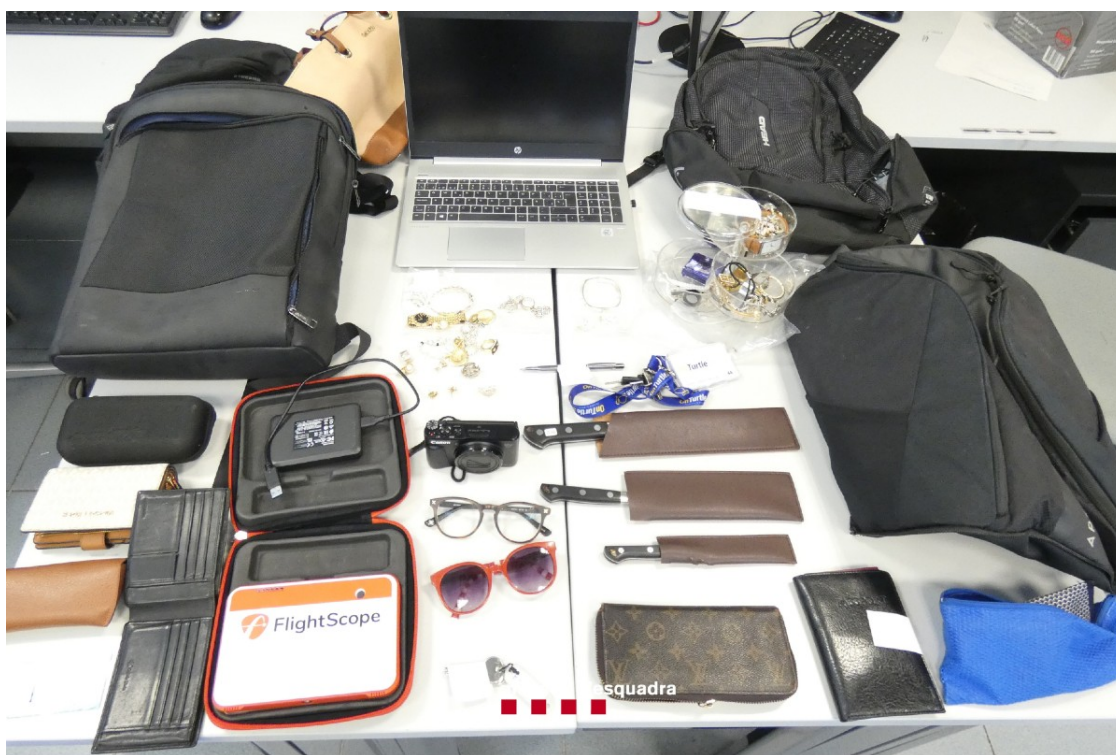
Objectes recuperats pels Mossos

Els Mossos d'Esquadra els atribueixen una desena de robatoris