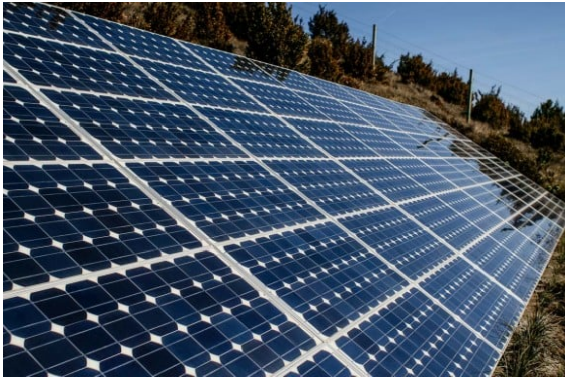
Plaques solars.

Puig s'oposa a un vet general als grans projectes per "la situació d'emergència" i aposta per obrir "un diàleg constructiu" amb els promotors i "posar condicions" per fer-los "socialment acceptables". En aquest sentit, creu que s'ha de discutir qui "es beneficia" d'aquests projectes per evitar que la riquesa es concentri en mans de pocs.