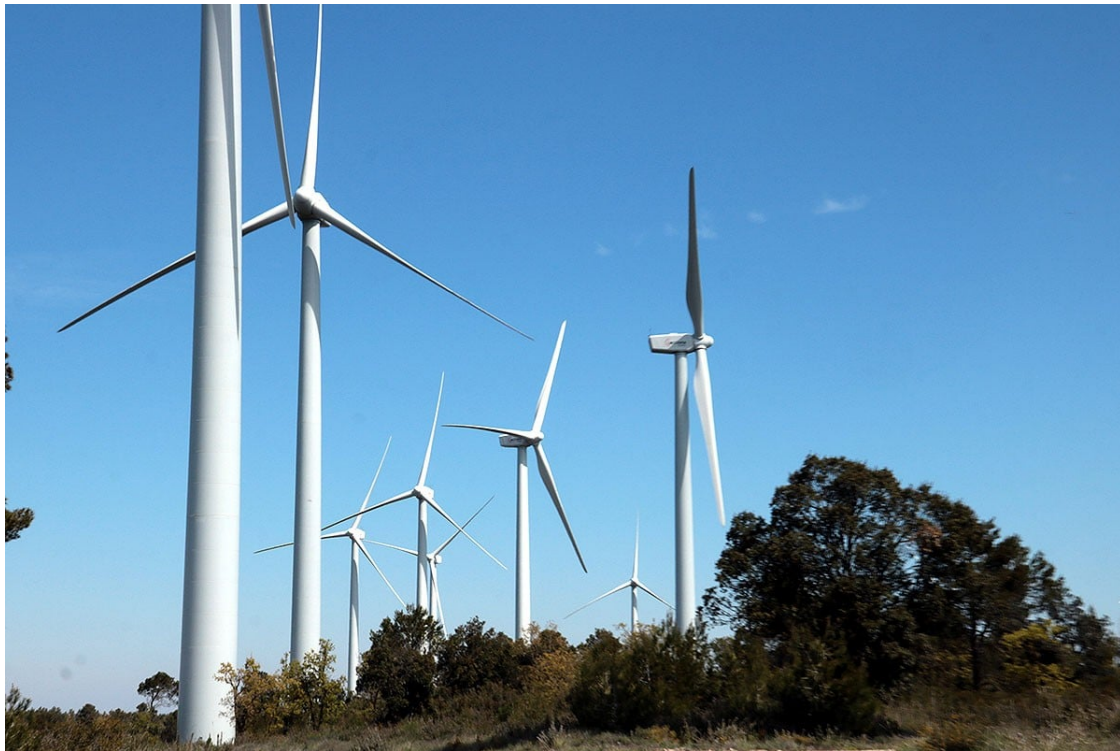
Parc eòlic de la serra de Vilobí

L'organització creu que se sobreestima el rebuig que poden generar les energies netes