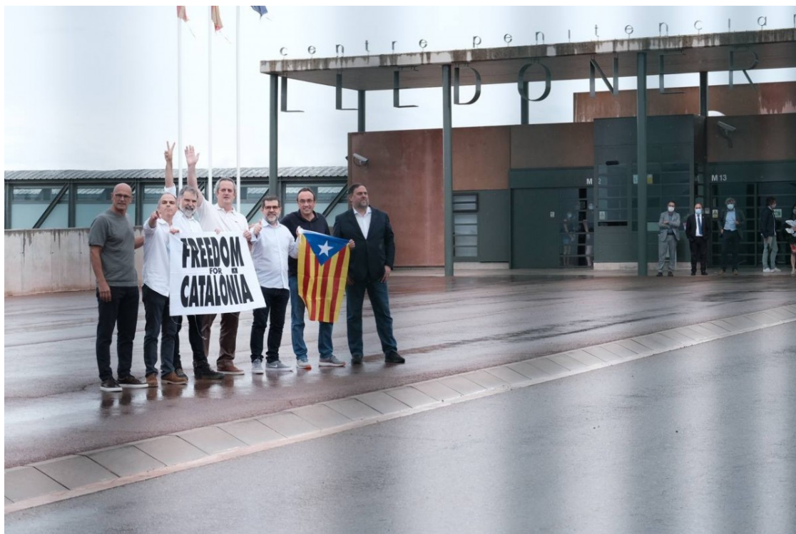
Els presos, just després de sortir en llibertat de Lledoners

Els nou condemnats per l'1-O surten de Lledoners, Wad-Ras i Puig de les Basses després de la concessió dels indults per part del govern espanyol