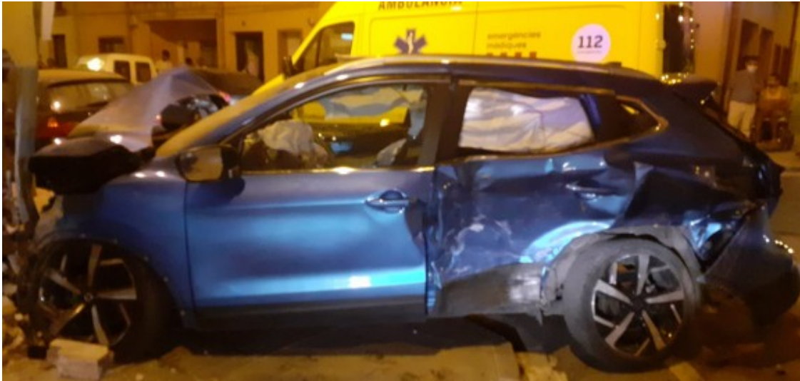
Accident de trànsit aquesta matinada a Sant Celoni