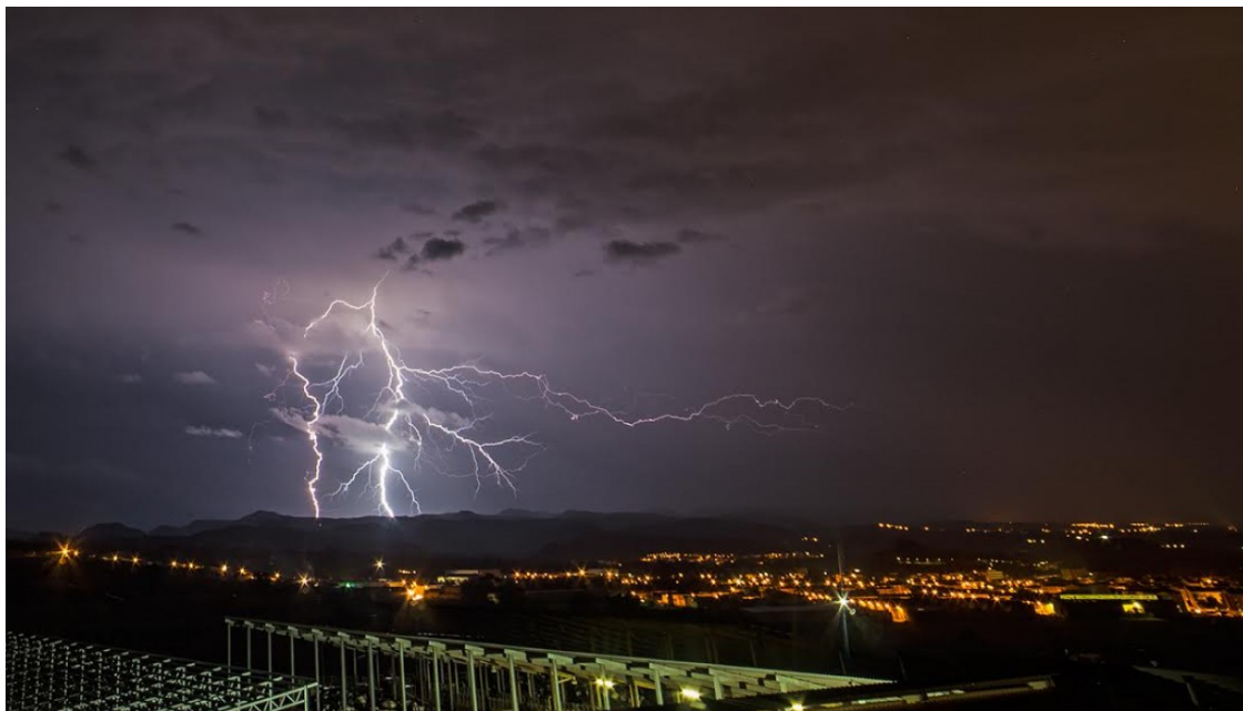
Llamps sobre Manlleu, aquesta nit | Carme Molist

Rius i rieres es troben en situació de normalitat però es manté l'alerta del pla Inuncat durant el dimarts