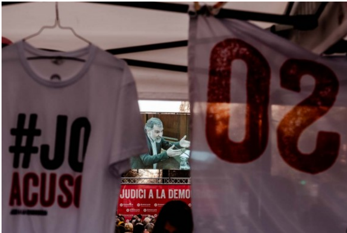
Centenars de persones segueixen la declaració de Cuixart al judici davant de la seu d'Òmnium

- La lluita no-violenta té per objectiu el diàleg. Recull tres estadis: la protesta i persuasió, la no-cooperació i l'acció no-violenta. Sempre apostarem per una solució dialogada. De fet com que renunciem explícitament a l'ús de la violència el que fem es treballar pel diàleg. Avui, però, som molt escèptics amb aquest PSOE de Pedro Sánchez. Fa temps que té a les seves mans encarrilar la resolució del conflicte, però continua acomplexat per la dreta i l'extrema dreta.