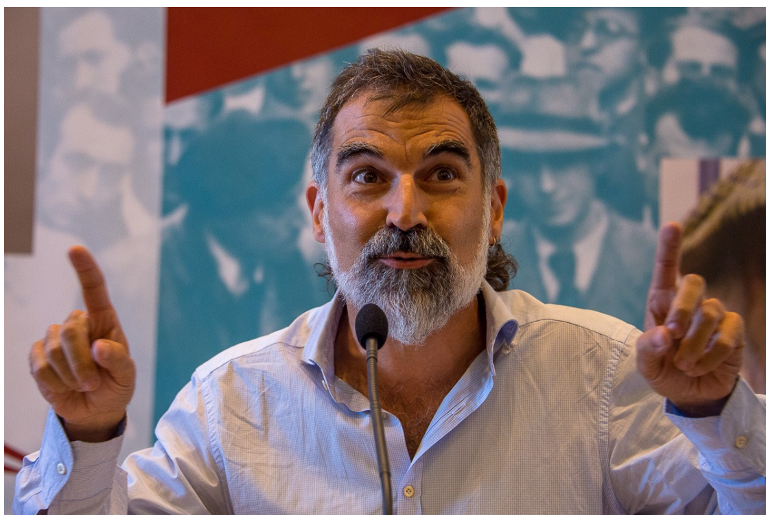
Jordi Cuixart en una imatge d'arxiu

El president d'Òmnium recomana "regar les relacions" per no reproduir xocs com els dels pactes postelectorals i sosté que el comportament de Sánchez amb Catalunya s'explica perquè sap que a Espanya "no el penalitzarà"