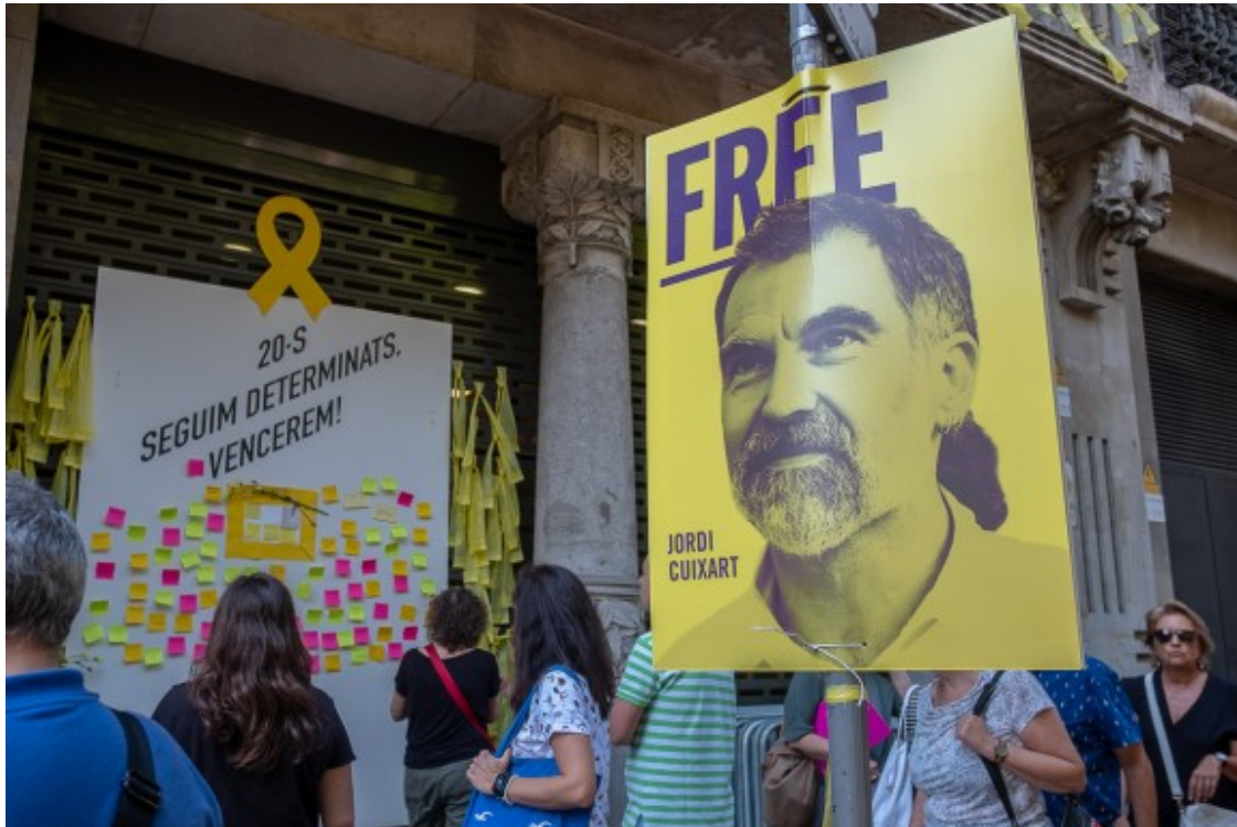
Primer aniversari del 20-S al Departament d'Economia.

- Què està fallant? Vostè prefereix no mirar enrere, no qüestionar-se què es va fer malament o qui n'és responsable, però la manca d'anàlisi compartida és un hàndicap per no posar-se ara d'acord en el com?