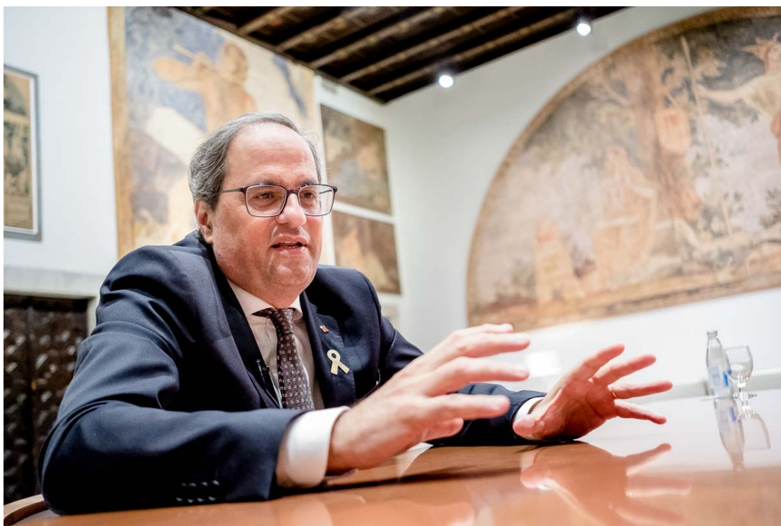
Quim Torra al saló Torres García

Malgrat les dificultats i urgències, Torra promet recuperar a l'octubre la iniciativa i l'autoestima: "Parlar com parlàvem, deixar enrere l'autocensura i tornar a sentir-nos lliures"