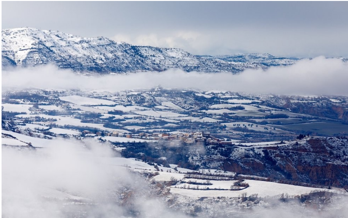
La neu pot arribar a bona part del país | Llibert Cases

L'episodi començarà aquesta tarda especialment a les comarques del nord-est i de la Catalunya Central